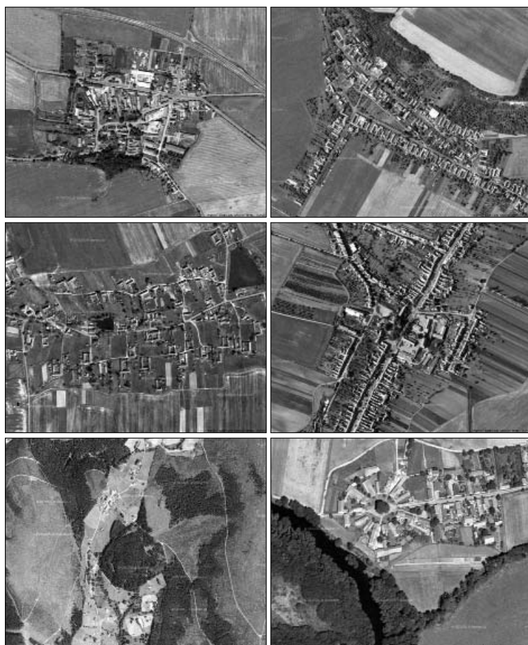
Obr. 2.9.1-6: Příklady půdorysných typů vesnic – letecké snímky