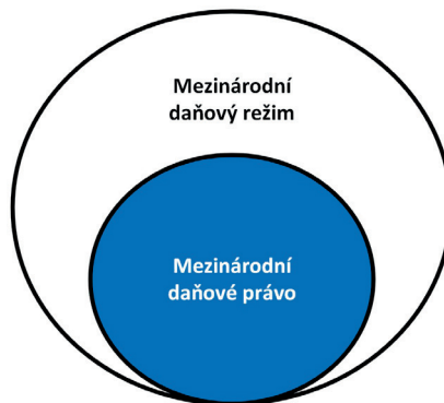
Schéma č. 2 – Mezinárodní daňové právo a mezinárodní daňový režim

Dané vyjádření autorky demonstruje Schéma č. 2.