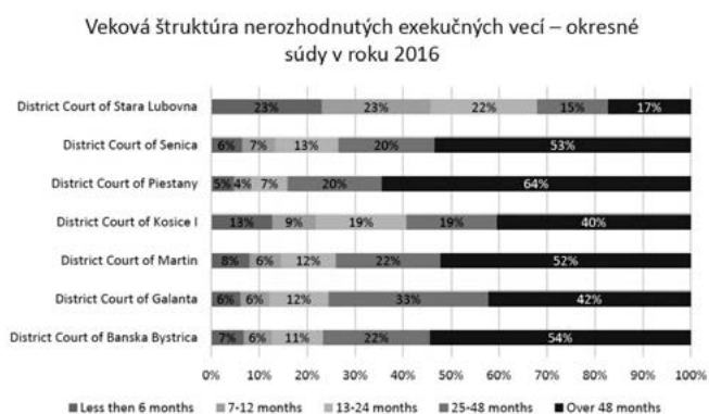
Tab. č. 4 – Veková štruktúra nerozhodnutých exekučných vecí na vybraných súdoch podľa Správy. 12

Podľa Správy, ktorá má charakter nezáväzného odporúčania, jeden z hlavných problémov slovenských súdov spočíva vo veľkom počte neskončených exekučných vecí. Tie predstavujú takmer všetky najstaršie konania vedené slovenskými súdmi.