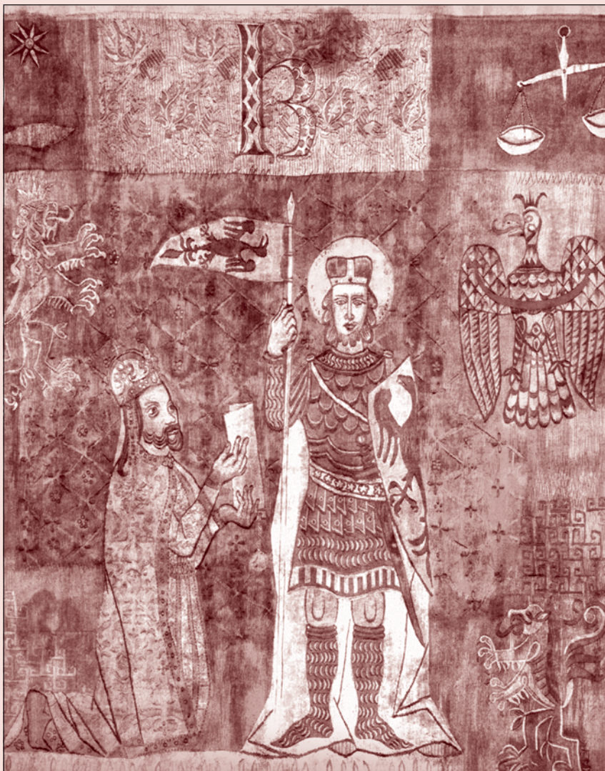
Karel IV. (goblén ve Velké aule Karolína).