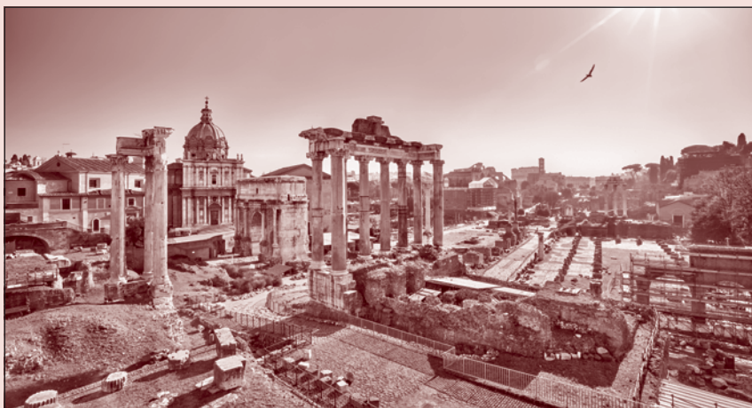
Forum Romanum, ruiny centra nejvýznamnější metropole antiky.