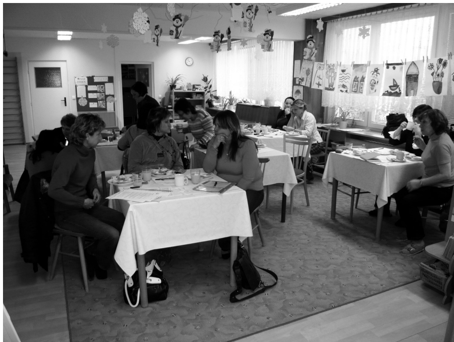
Obr. 16 Společné učení

Cílem síťování škol je sdílení vzájemných zkušeností, podpora vzájemného učení škol a pedagogů. Proces síťování vytváří možnost přístupu k novým informacím. Síťování škol vytváří partnerství na základě dohodnutých potřeb a základních principů, kterými jsou svobodná volba a zodpovědnost. Význam rozvoje všech forem spolupráce učitelů mateřských škol spočívá ve zlepšení kvality předškolního vzdělávání.