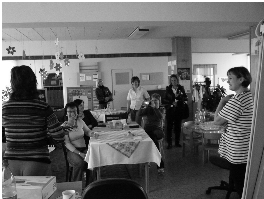
Obr. 17 Vzájemné návštěvy